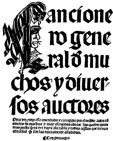
Portada de la segunda edición del Cancionero general (Valencia, Jorge Costilla, 1514)

La actuación de Kofman, que en el espacio de dos años tuvo el volumen de ejemplares pactados, demuestra el dinamismo de la imprenta en la Valencia de principios del siglo xv, y subraya la eficiencia del impresor, seguro de que el proyecto llegaría a buen puerto.