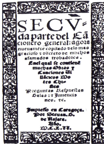
Portada de la Segunda Parte del Cancionero General (Zaragoza, Esteban Nájera, 1552)

Volviendo a la poesía lírica, los treinta y siete poemas del Vergel de amores , 205 caprichosa selección sin orden que nos plantea numerosos problemas de atribución, son descendientes del Cancionero general . Con todo, el éxito del Vergel animó a su impresor, Esteban Nájera, a publicar una Segunda parte del Cancionero general (Zaragoza 1552).