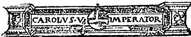
Grabado de la elición de Medina del Campo (sin fecha)