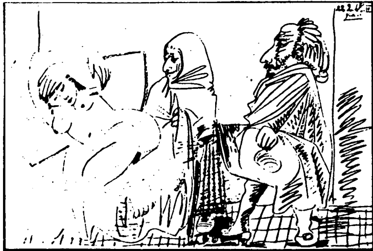
PABLO PICASSO 1968