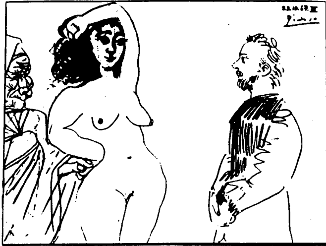
PABLO PICASSO 1967