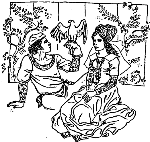
Act I. Illustration by Jaime Azpelicueta. Ed. Juventud.

All references to Celestina's age come from the speech of the characters themselves; each expresses himself/herself according to circumstances of the moment. The diversity of personal references made by the characters does not make impossible the matter of a "real" age estimate for Celestina. Rather, when isolated and regrouped, they yield up a different composite, as we have seen, which suggests a Celestina who is perhaps a generation younger than we have assumed from the often cited reference to her "seys dozenas de años" (II, 126).