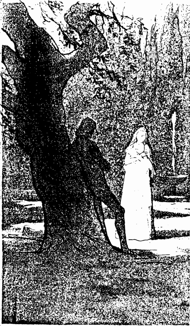
Act 1. Illustration by Dodie Masterman. London: Folio Society, 1973.