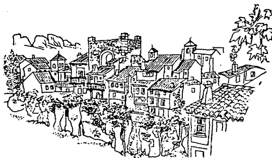
Ilustración de Jaime Azpelicueta a la Celestina (Ed. Juventud)

14 España y la tradición , vol. I, p. 141.