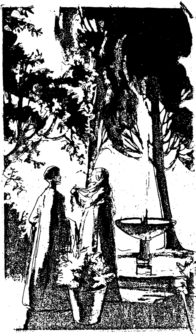
Act 19. Illustration by Dodie Masterman. London: Folio Society, 1973.