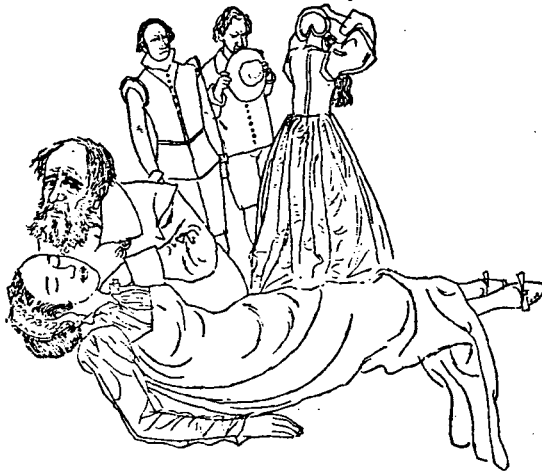
Act 2. Illustration by Jaime Azpelicueta. Ed. Juventud.

7 Pleberio refers often to his advanced age (XX, 189-90; XXI, 203, 205, 209 [twice] and 212), in contrast to the youth of Melibea. He also refers, less vaguely, to "mis sesenta años" (XXI, 202) during his lament for his recently deceased daughter. Here too, however, we may doubt the exactitude of the suggested age. His "sixty" is just as much a rounded-off number as Celestina's "sixty," and, similar to the old woman's situation, Pleberio's interest here is to exaggerate his age. Even if we accept sixty as an accurate age for Pleberio, we need not therefore find Celestina's "sixty" more credible. Fatherhood is not so biologically restricted by age as motherhood; Pleberio nowhere alludes to the age of his wife, Alisa.