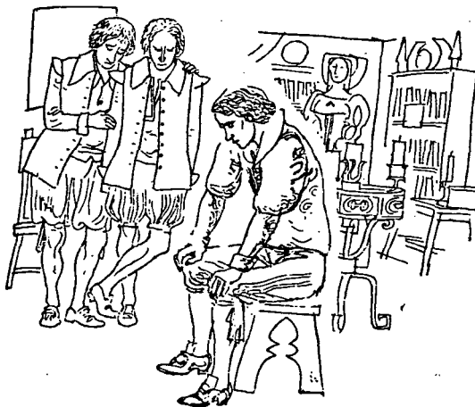
Act 13. Illustration by Jaime Azpelicueta. Ed. Juventud.

14 González Muela, p. 138, cites the same saying from the Catalán Lo Somni of Bernat Metge.