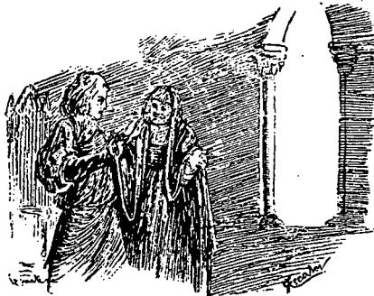
Ilustracion al VI o auto por Escobar. Barcelona, 1888.

[158]... illico me interpellato ne quid desit. Quod ad processum ulteriorem attinet, in occulto acta sunt; proinde nil temere pronunciandum. Executio forsitan sponte prodibit, et.