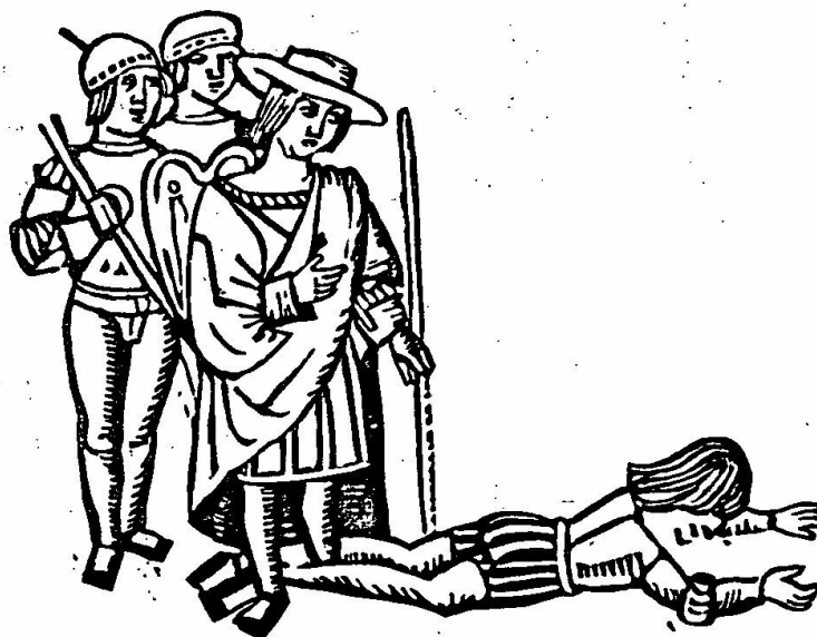
Calisto despenado (Cover from Teatro Medieval , ed. Manuel Criado de Val).