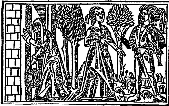
Portada de la edición Toledo 1500 (detalle)