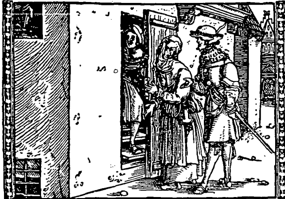
Celestina y Sempronio llegan a la casa de Calisto. Aucto V.

De la traducción alemana de C. Wirsung (1520).