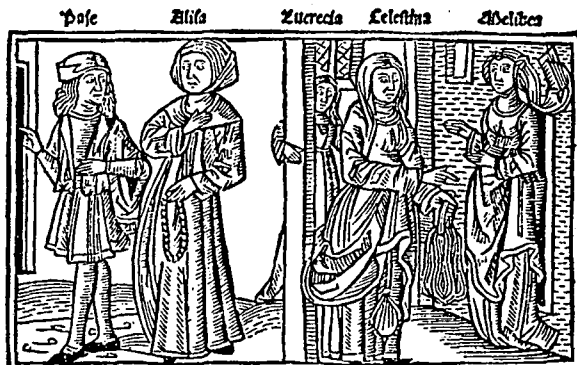
Aucto IV Burgos, 1499?