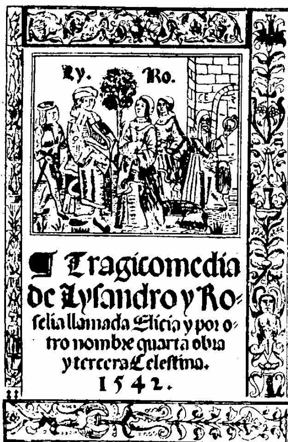
Sancho de Muñón. Portada de su Tragicomedia de Lisandro y Roselia.