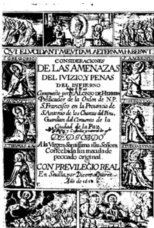
Portada de la edición en Sevilla, 1618. Dominio público

Avecindado en Perú, durante la segunda década del siglo XVII el fraile franciscano Alonso de Herrera Salcedo escribió su tratado 4 Consideraciones de las amenazas del juicio y penas del infierno , después de que algunas personas de su auditorio le pidieran poner por escrito aquello que predicaba cada viernes en las plazas públicas del virreinato peruano. El autor afirma que lo hizo para que los lectores, tanto como sus oyentes, tuvieran un «espejo de desengaño» y reconocieran la verdad. Anuncia este concepto intencional de la obra en general y luego lo amplía, específicamente en el párrafo cuarto del capítulo IV. Durante su tiempo, el concepto del desengaño de la vida era piedra angular del pensamiento rector de la religión occidental, aparece como objetivo implícito y expreso en tratados morales, sermonarios y libros de oración. Los poetas líricos y dramáticos lo incluyen en sus piezas críticas, satíricas y trágicas. Desde esta perspectiva, el mundo, la carne y el diablo, los enemigos seculares de la humanidad, engañan a los incautos o desprevenidos, la tarea de los predicadores e inquisidores consiste en combatir las ilusiones pasajeras, los humos de la vanidad, los errores de los sentidos, es decir, desengañar. 5