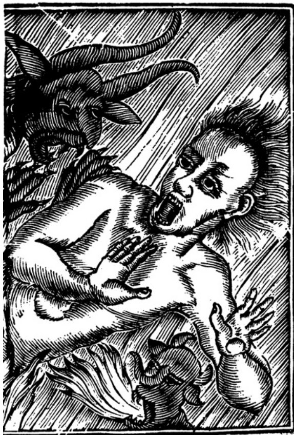
Ilustración de la compañía de los condenados en El infierno abierto . Dominio público