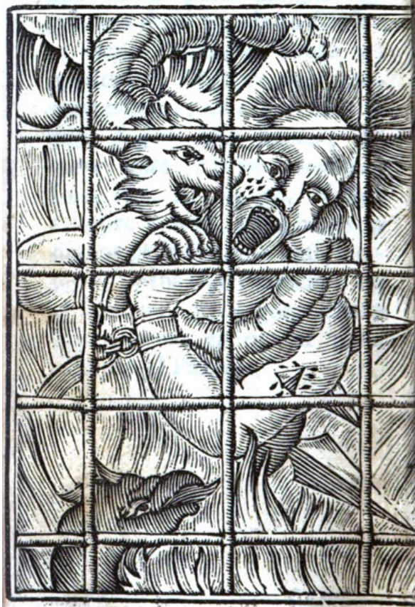
Ilustración de la cárcel del infierno en El infierno abierto . Dominio público

Ya inmóviles y olvidados de la misericordia divina, los presos son abrasados en cuerpo y alma por dentro y por fuera con un fuego especial, una materia ígnea que tiene características extraordinarias, correspondientes al propósito de cobrar venganza sobre los impíos, pues es poderoso en calidad y cantidad, violento, inextinguible, proviene de las alturas como si fuera una espada de Dios, y su quemadura es más ardorosa que el fuego común. «Finalmente, nuestro fuego destruye lo que abrasa, y por lo mismo cuanto es más intenso tanto es más breve; pero el fuego en que arderán siempre los réprobos abrasará sin consumir». 146