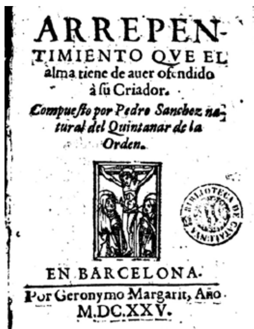
Portada de la edición de 1625. Dominio público

Todavía más paradigmático en la doctrina cristiana es el hecho de que, además del reconocimiento y clasificación de los pecados o transgresiones, además de la distinción entre fieles y herejes, entre píos y pecadores, asuntos que conformaron todo un género literario con ribetes ascéticos y místicos, el sistema encontró en los actos de contrición, atrición, confesión, penitencia y expurgación, las pulsiones espirituales suficientes para propiciar el auto reconocimiento del creyente como transgresor. 198