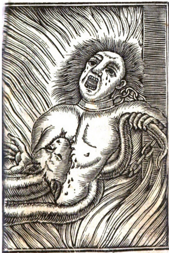
Ilustración de la compañía de los condenados en El infierno abierto . Dominio público