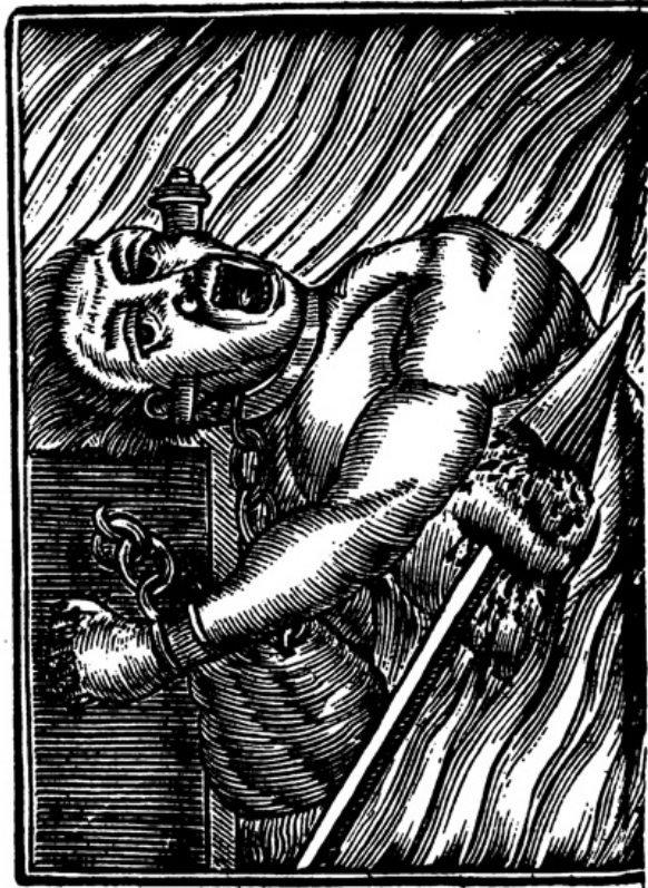
Ilustración de la eternidad de las penas en El infierno abierto .

Como el anterior recorrido descriptivo muestra, esta obra puede considerarse un caso típico de la retórica del miedo y la ideología didáctica acerca del infierno. Su cariz aleccionador es contundente en cada peroración lectiva y el uso del lenguaje dramático se refuerza con las ilustraciones de personajes anónimos en plena tortura infernal. Además, en cada apartado es posible descubrir párrafos de intenso dramatismo, o cuadros exclamativos de horror, descritos sintéticamente; en ocasiones, el lirismo del autor logra párrafos emotivos que alejan el discurso del ensayo o del tratado devocional y lo acercan a la oratoria, o incluso, a la poesía. Al disertar acerca de la extensión de la conciencia culpable y desesperada, Pinamonti, borda un párrafo ejemplar. Lo cito en extenso porque además expresa una acertada síntesis de la percepción antigua respecto a los castigos infernales.