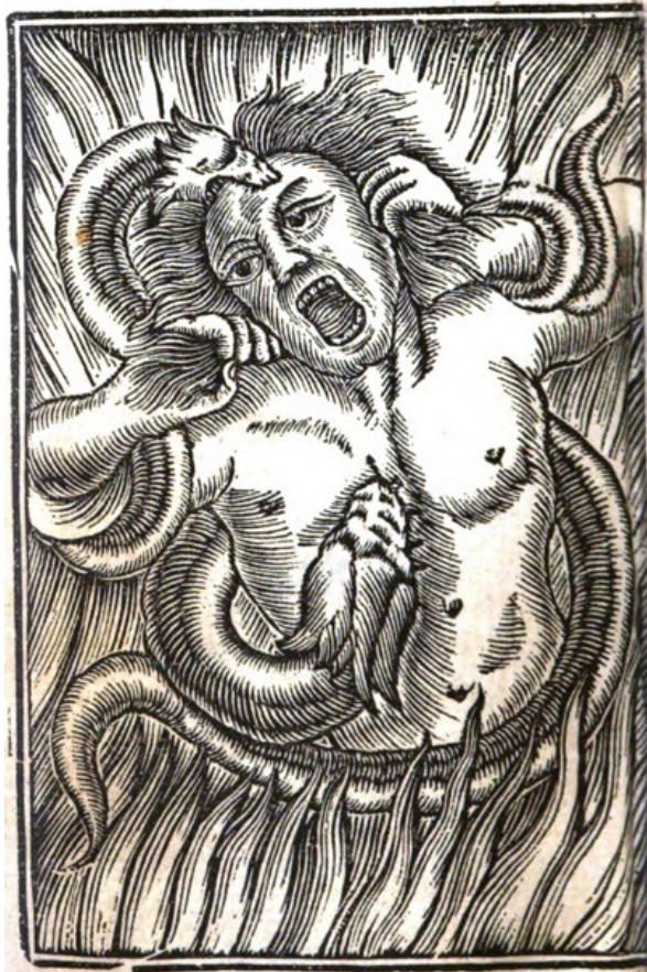
Ilustración de la desesperación en El infierno abierto . Dominio público

La sétima y última consideración establece, en explicación reiterada, que las penas son intolerables por eternas e intensas; invariables, fijas y constantes, por ende, tediosas, fastidiosas y desesperantes; en especial son justas, directamente proporcionales a las ofensas de los pecadores, y al poder aplicado de la justicia divina.