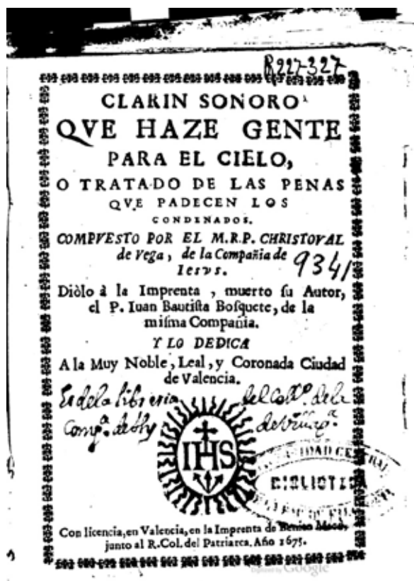
Portada de la edición en Valencia, 1675.