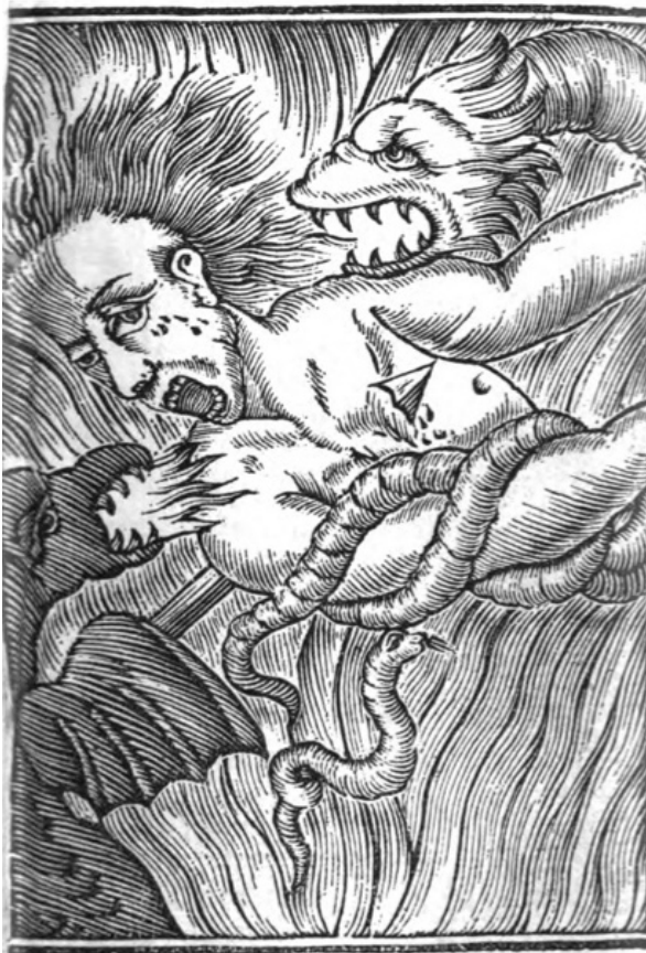
Ilustración de el fuego infernal en El infierno abierto .

El siguiente punto de reflexión y por tanto referido a un tormento en la cárcel del averno, consiste en la función de tres tipos de personajes que acompañan a los pecadores en el martirio. En primer lugar, los otros condenados, los iguales en el castigo. Pinamonti afirma que se trata de una vecindad insufrible, parte de la tortura, pues unos a otros son ingratos. «Serán los condenados como espinas que abrasándose entre las llamas, se punzarán, y se arruinarán, sirviendo el uno al otro de un continuo tormento». 147 En segundo lugar, tendrán la compañía de los innumerables demonios burlones y agresivos, enemigos de la humanidad, en funciones de verdugos operarios e instrumentos de la justicia. «Ellos afligirán de dos maneras a los condenados: con el aspecto y con las