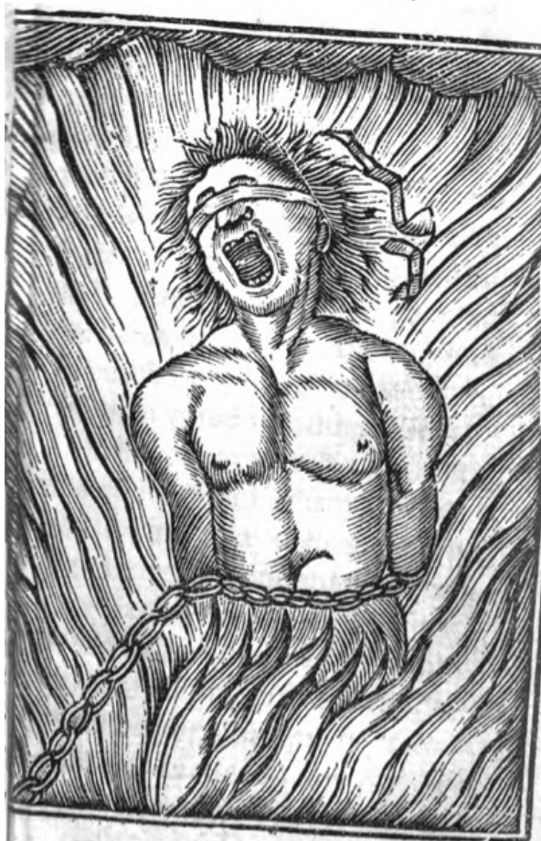
Ilustración de la pena de daño en El infierno abierto . Dominio público

Si la pena del daño, o ausencia del amor de Dios constituye el castigo mayor, los tradistas enfatizaron las dolorosas condiciones de las almas atormentadas en el averno por las penas de sentido. Como ya se afirmó, estas descripciones negativas fueron base de la retórica aleccionadora e instrumento de amenaza preventiva.