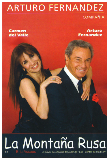
Programa de mano de La Montaña Rusa. La actriz junto al reconocido Arturo Fernández.