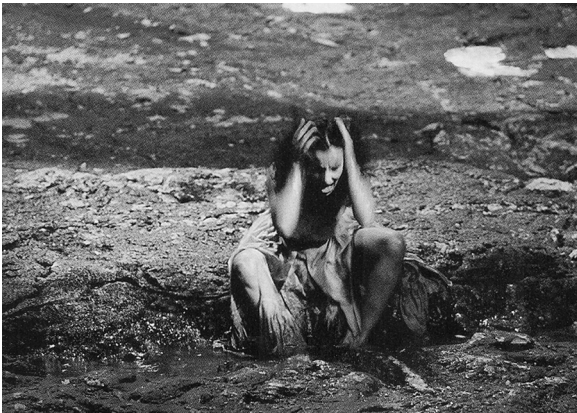
Tres escenas de la obra El alcalde de Zalamea © Fotos cedidas por Carmen del Valle.