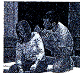
Una de las escenas.